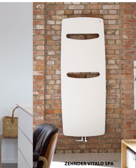
ZEHNDER VITALO SPA