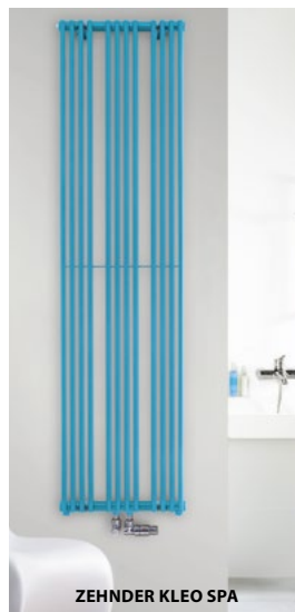
ZEHNDER KLEO SPA