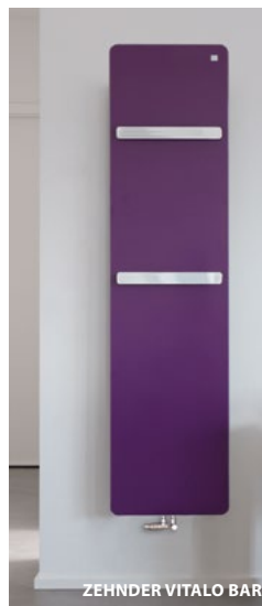
ZEHNDER VITALO BAR

Aprobaty i certyfikaty: komplet dokumentów dopuszczających